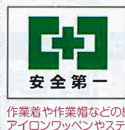
安全衛生マーク 2WAY ワッペン No.44090 定価 1,870円 5枚入

●サイズ: H37.5×W50mm ●材質: ポリエステル ※2WAY: アイロンワッペン・ステッカー両用タイプ