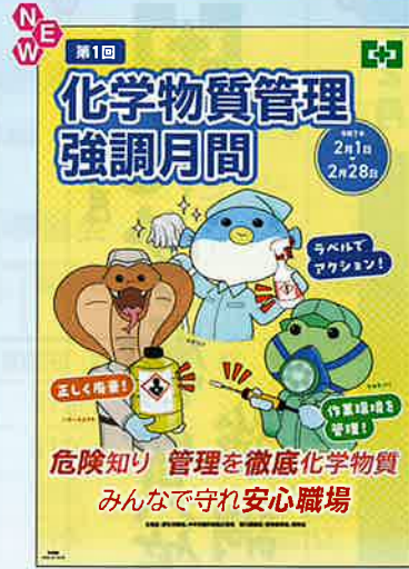
スローガン B No.31352