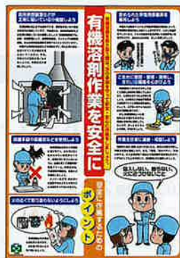
有機溶剤作業の安全 No.31582