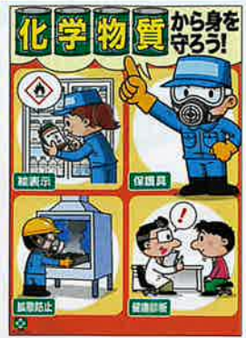
化学物質・身を守る No.31864