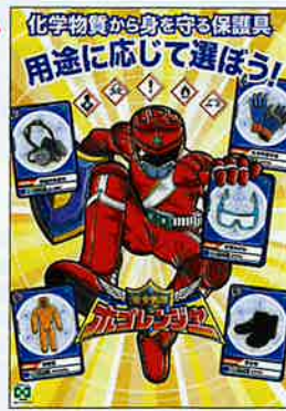
化学物質・保護具 No.31898