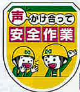
声かけ・安全作業ワッペン No.44085 定価 825円

●サイズ: H83×W50mm ●材質: ビニール ●ピン付/透明ポケット付/中紙挿入式/中紙 (H40×W15mm) 付