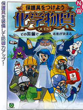
化学物質・保護具つける No.31931