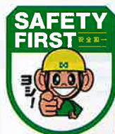
セーフティワッペン (ヨシだ君) No.44073 定価 825円