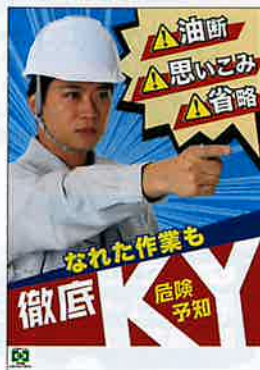
徹底KY・危険予知 ※在庫限り No.31866