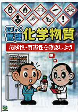
化学物質・正しく管理 No.31923