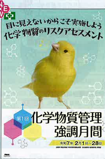
スローガン C No.31354