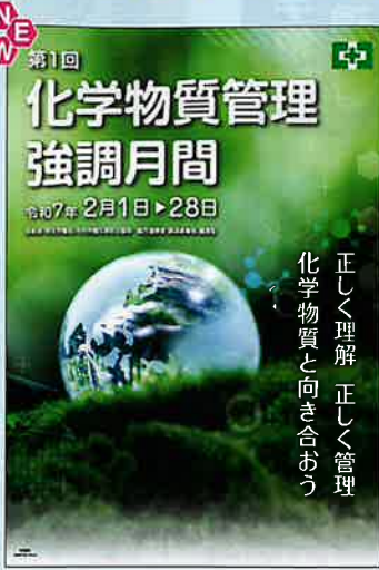
スローガン A No.31350