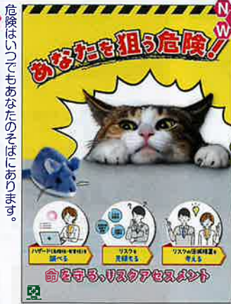
狙う危険・リスク No.31930