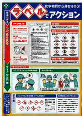
化学物質・ラベル No.31600