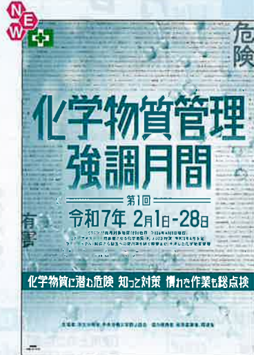
スローガン D No.31356